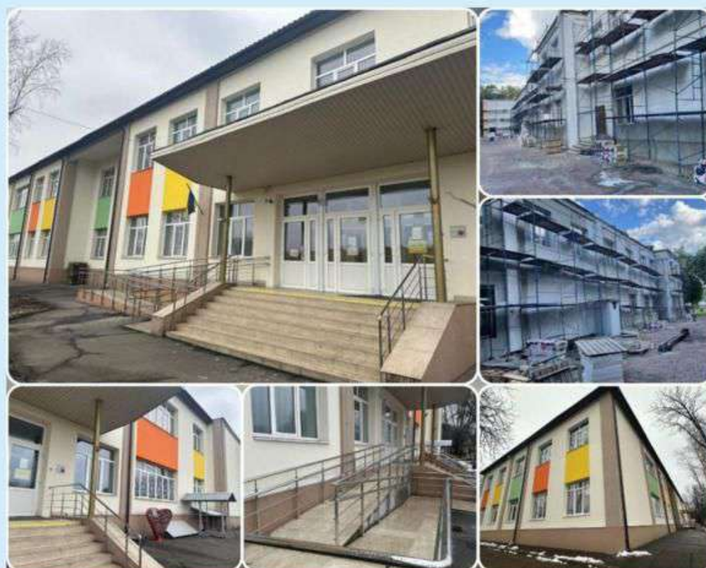
Капітальний ремонт фасаду та покрівлі Гімназії №150