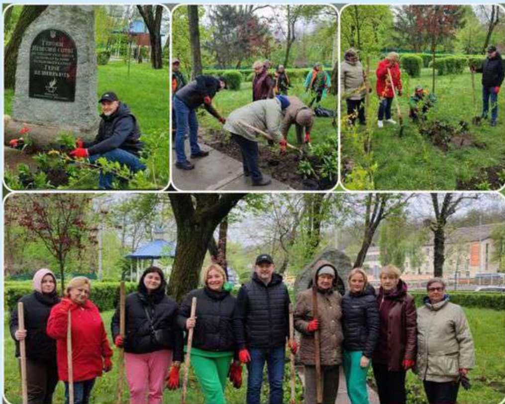
Озеленення району до Дня довкілля