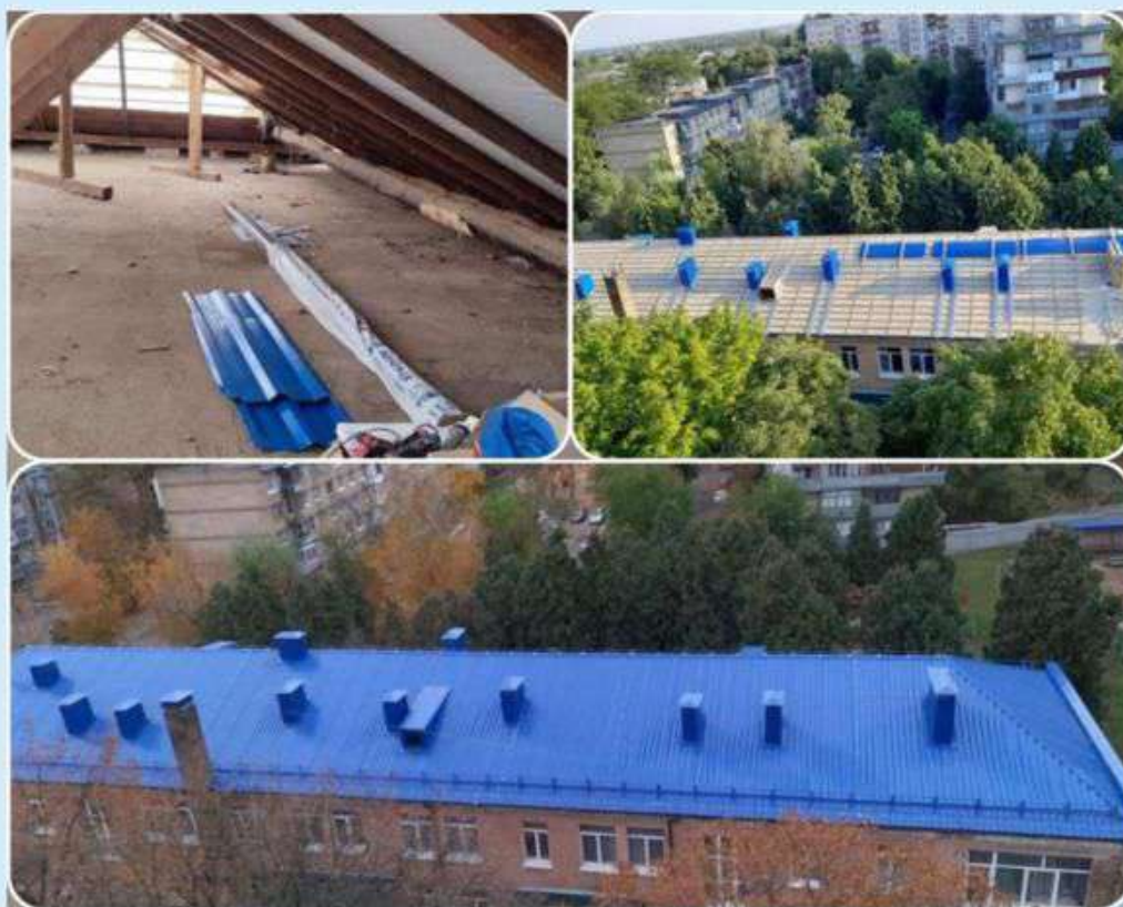
Ремонт покрівлі в Дошкільному навчальному закладі №389