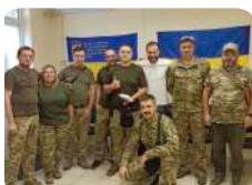
Підтримка та допомога в забезпеченні необхідним ДФТГ ДВРЗ