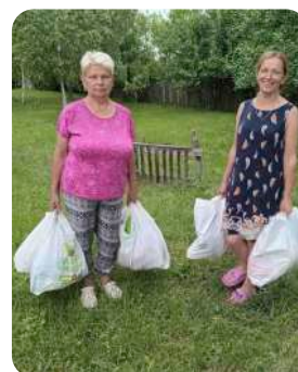
Передано біля 16 тон гуманітарного вантажу на деокуповані території постраждалим громадам