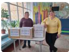
Спільно з учнями шкіл району передано благодійну допомогу військовим