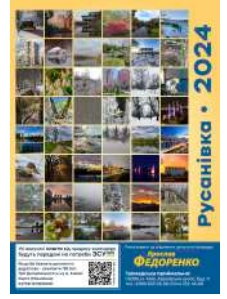
Збір коштів завдяки благодійним календарям