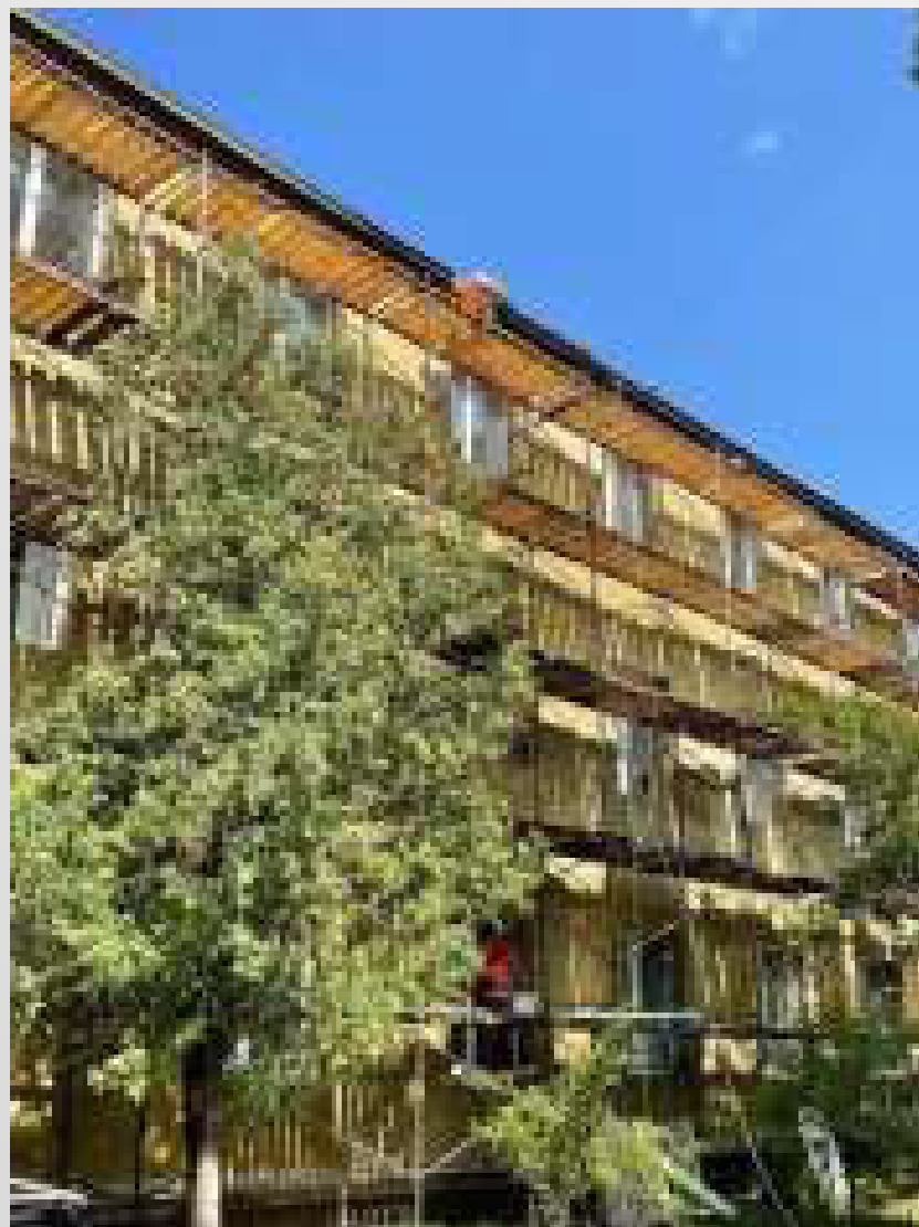
Київська дитяча школа мистецтв № 6 ім. Г. Л. Жуковського