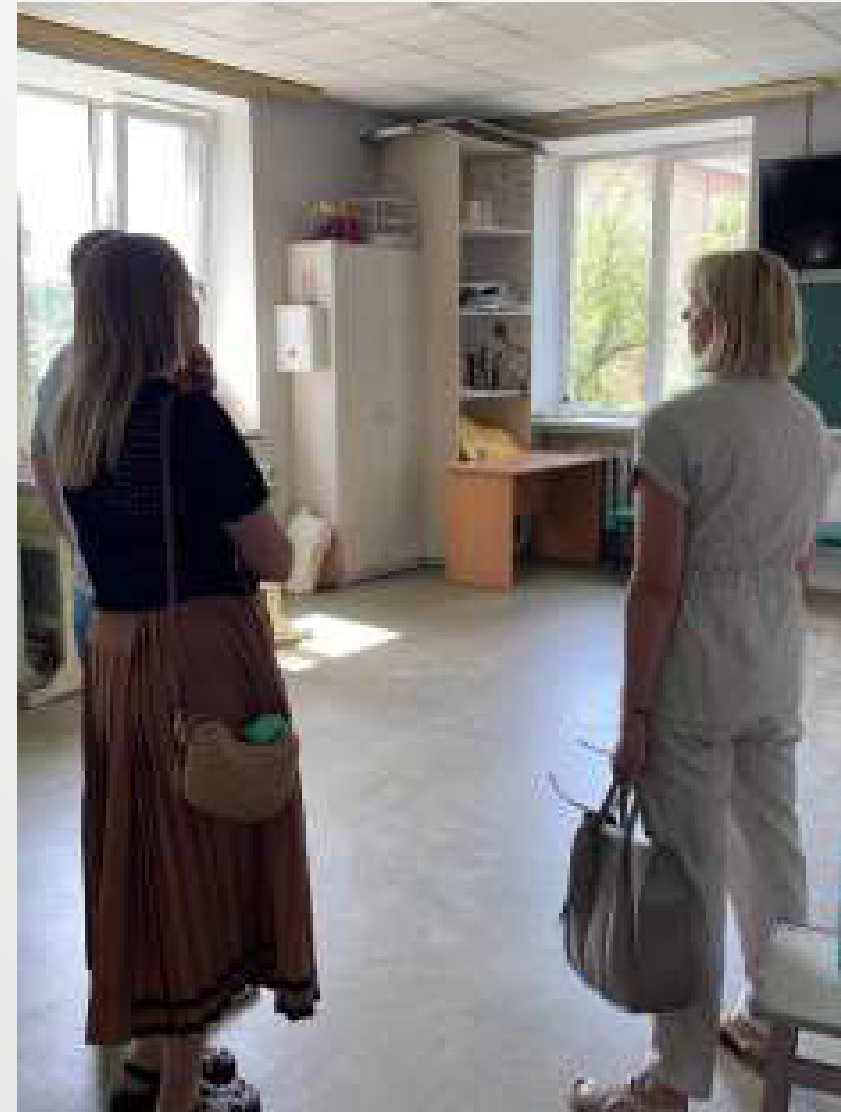
бульв. Верховної Ради, 15 (Дніпровський район) – розпочато роботи з утеплення фасаду та внутрішні оздоблювальні роботи в навчальних кабінетах, коридорах і санвузлах.