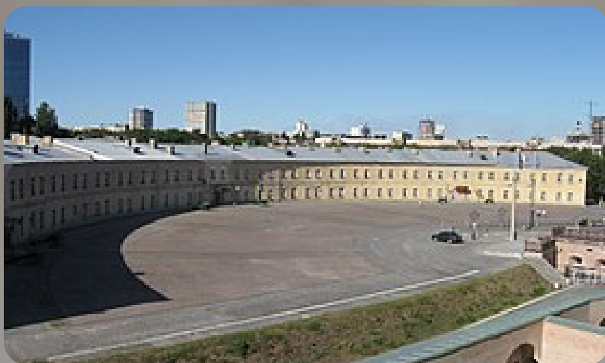
«Вали та рови Васильківського укріплення Київської фортеці» 1832-1839 рр.