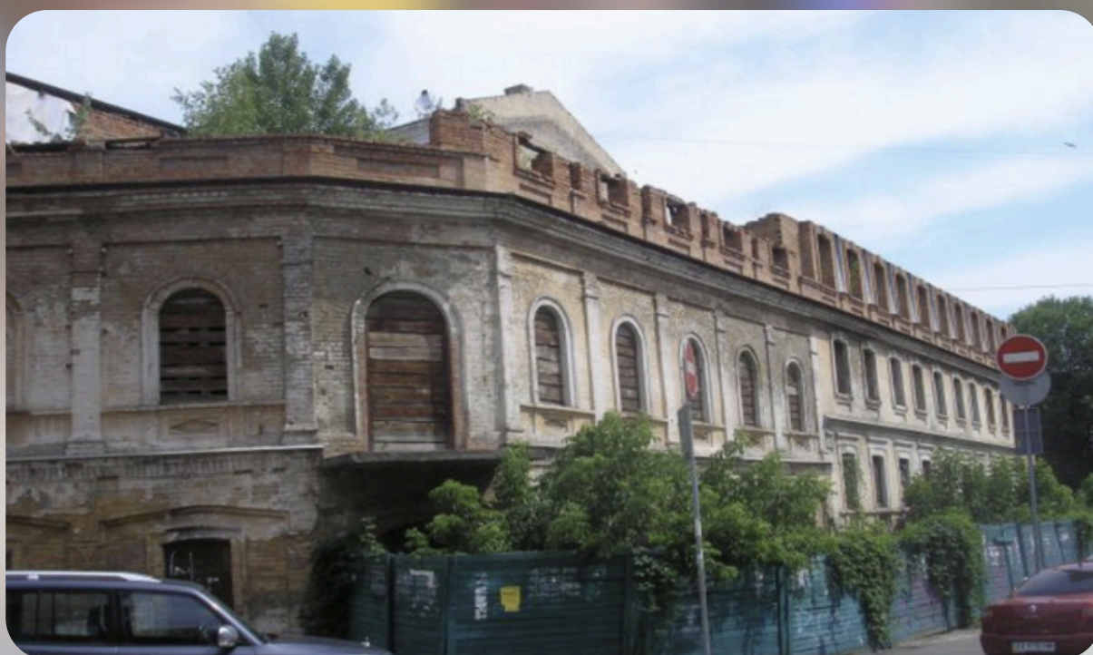
Історичний будинок на вул. Волоській, 2/21/19