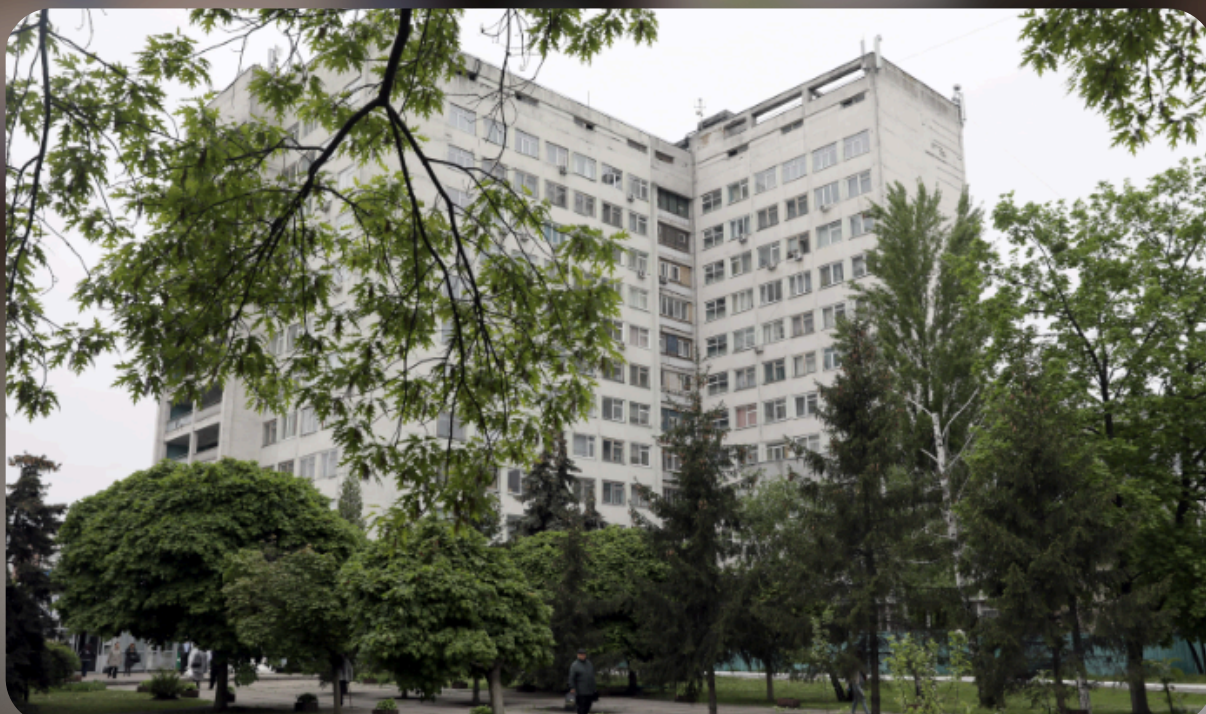
Лікарня швидкої допомоги на вул. Братиславська, 3