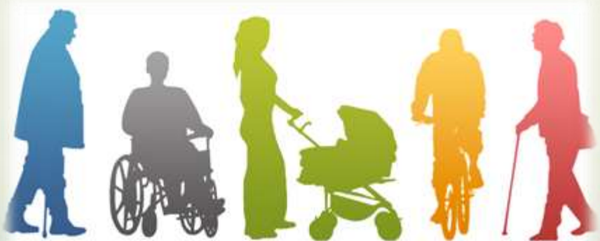
Депутатський фонд 2024