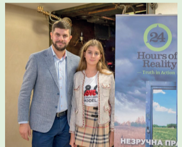
Екологія – відповідальність кожного киянина