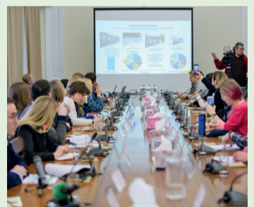
5 років на захисті екології