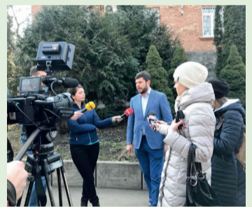
Звіт про подані та виконані пропозиції ремонтних робіт житлового фонду виборчого округу № 119 за 2019 рік