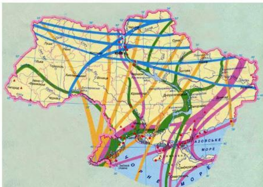
Схема сезонних міграцій птахів на території України