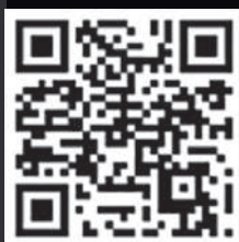
Шаблони подання запитів на проведення громадської експертизи