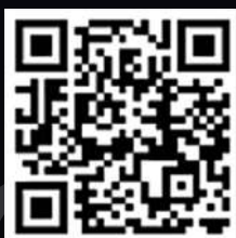
Приклад запиту на проведення громадської експертизи