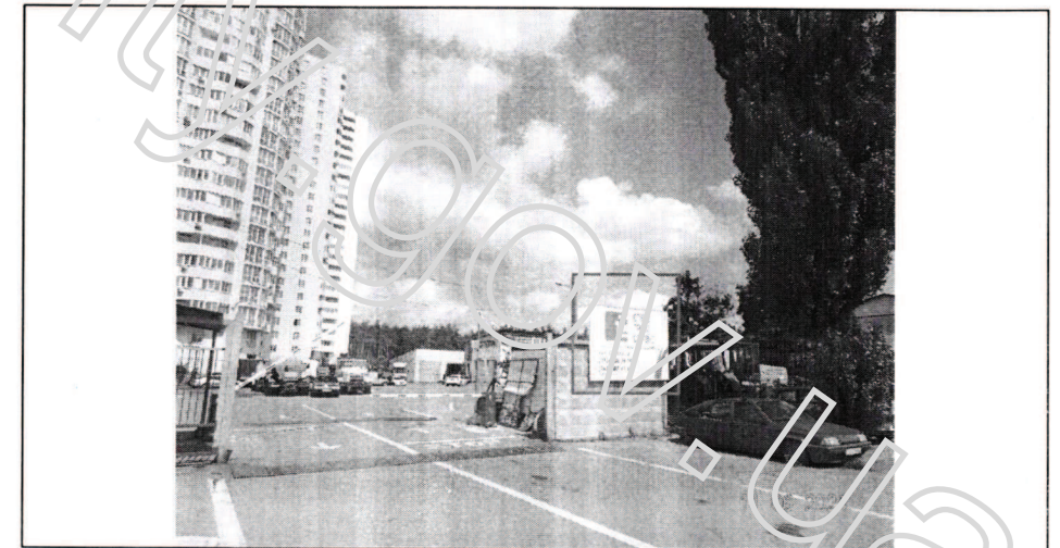
Фото фіксація розміщення РЗ типу: Конструкція на елементах огороження (банер, панно та інші)