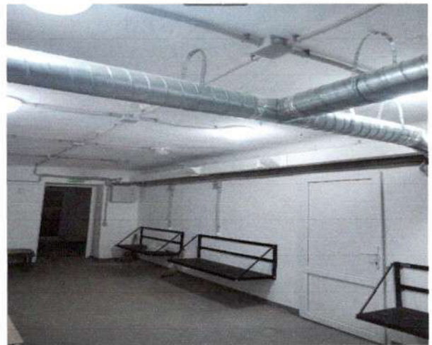
Ремонт укриття за адресою: вулиця Михайла Брайчевського, 12