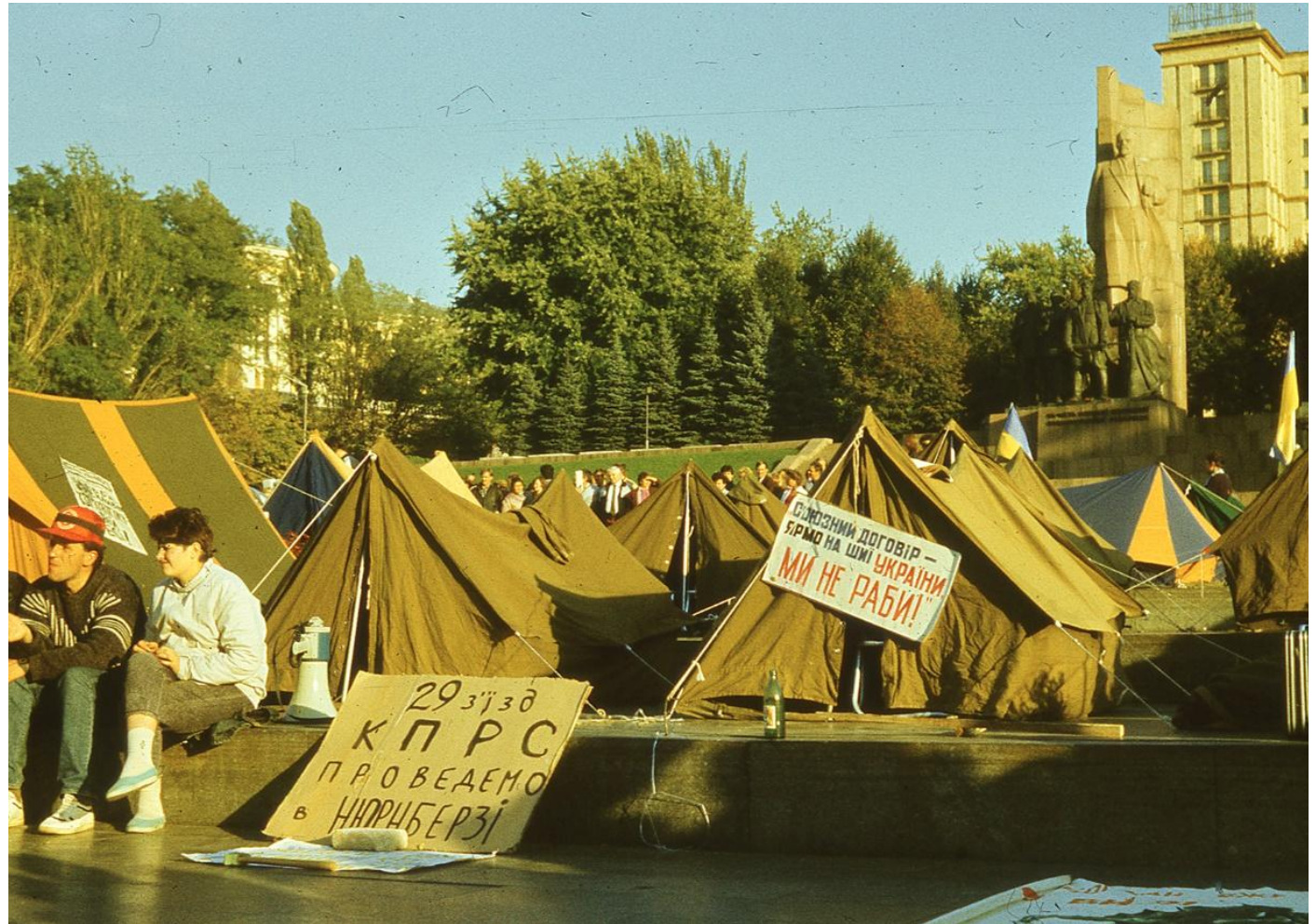
Плакати наметового містечка.