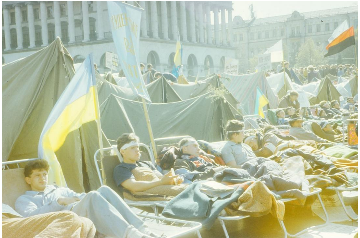
Учасники голодування.

Ще частина учасників носила чорні – ті, хто відповідав за безпеку голодувальників.