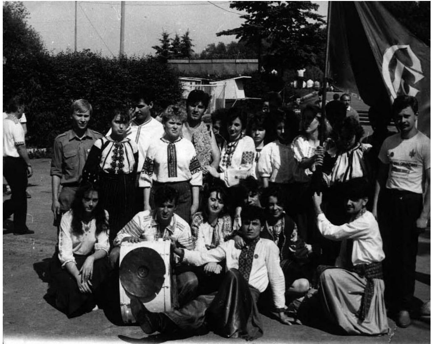
Учасники Студентського братства Львова.

Студентське братство Львова налагодило контакти з іншими українськими студентськими об'єднаннями, зокрема Українською студентською спілкою (УСС). На спільній нараді ухвалили рішення розпочати акції протесту на початку жовтня 1990 року.