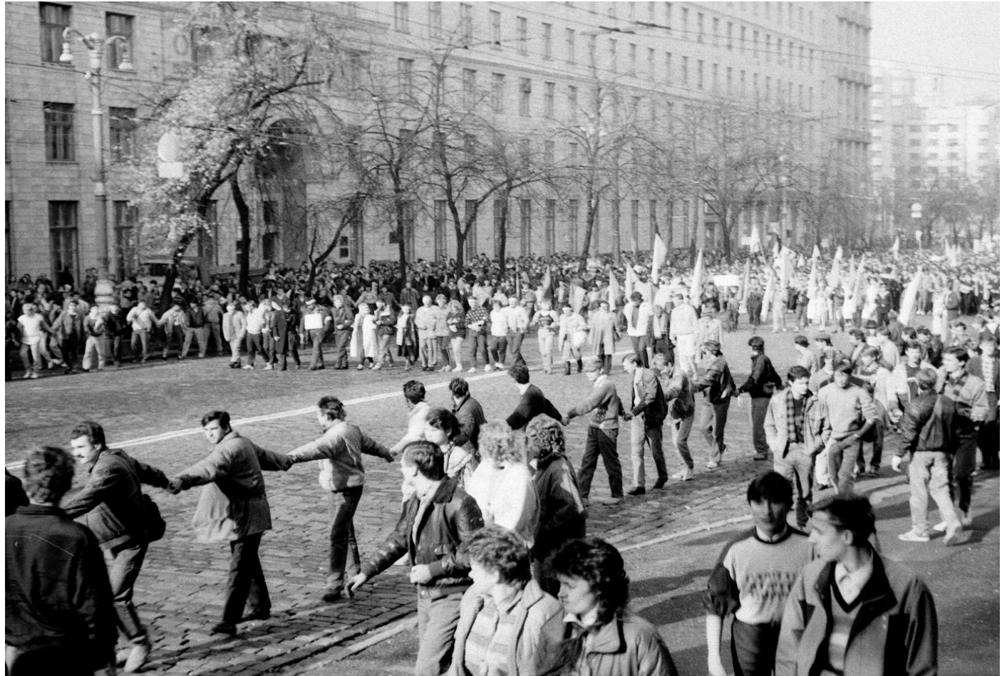
Хода до будівлі Верховної Ради УРСР.