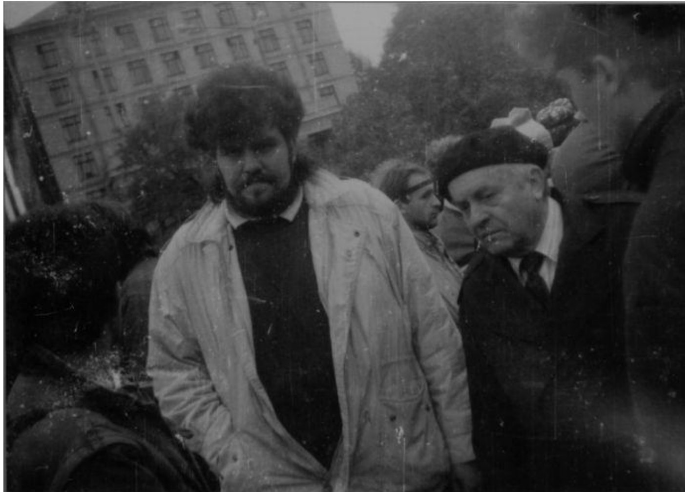
Голова СБЛ Маркіян Іващишин і поет, народний депутат СРСР від демократичних сил Ростислав Братунь у студентському наметовому містечку.