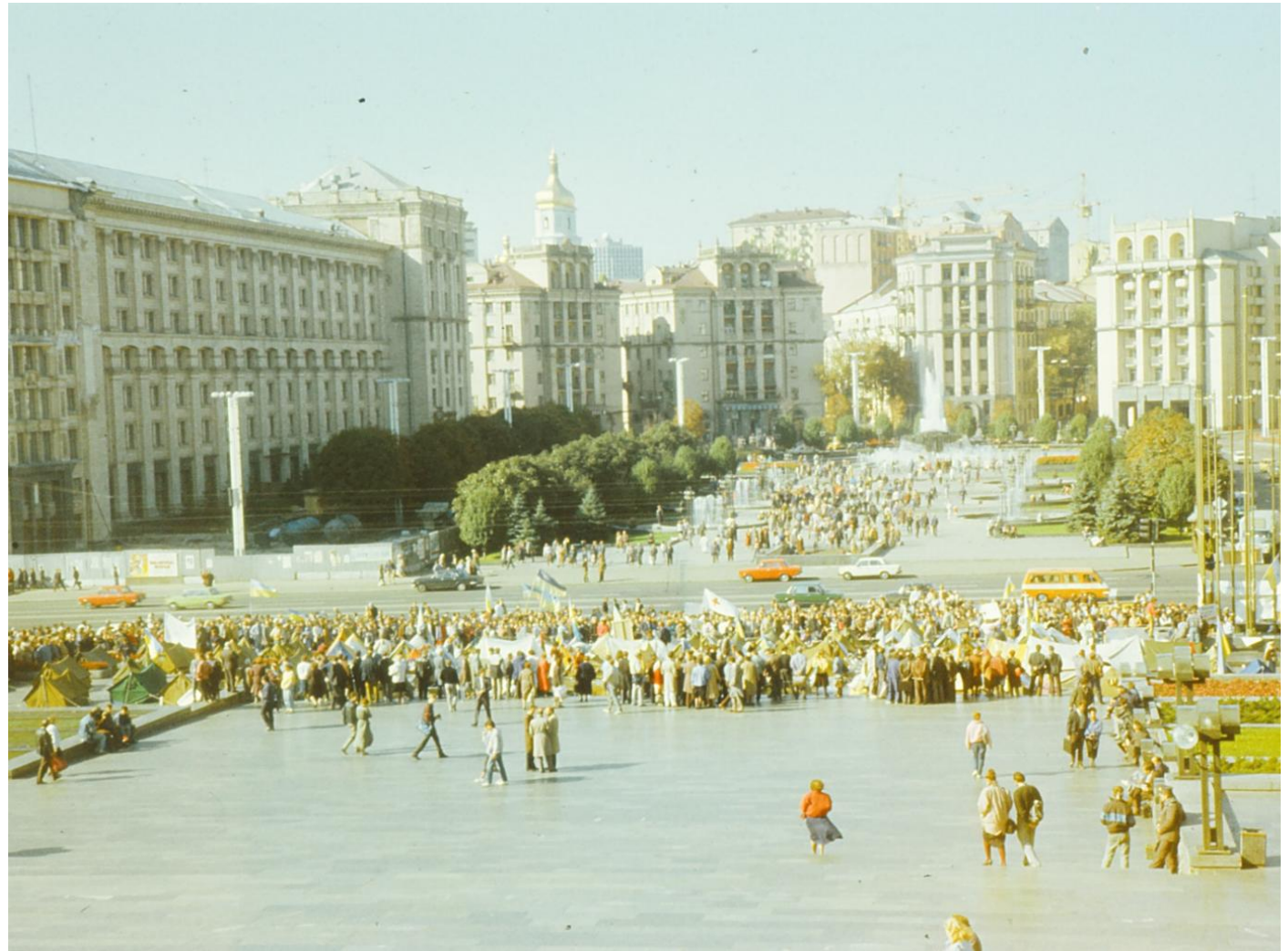
Вигляд табору протестувальників.

Після цього протест, який до того називали Студентським голодуванням на граніті, отримав назву «Революція на граніті».