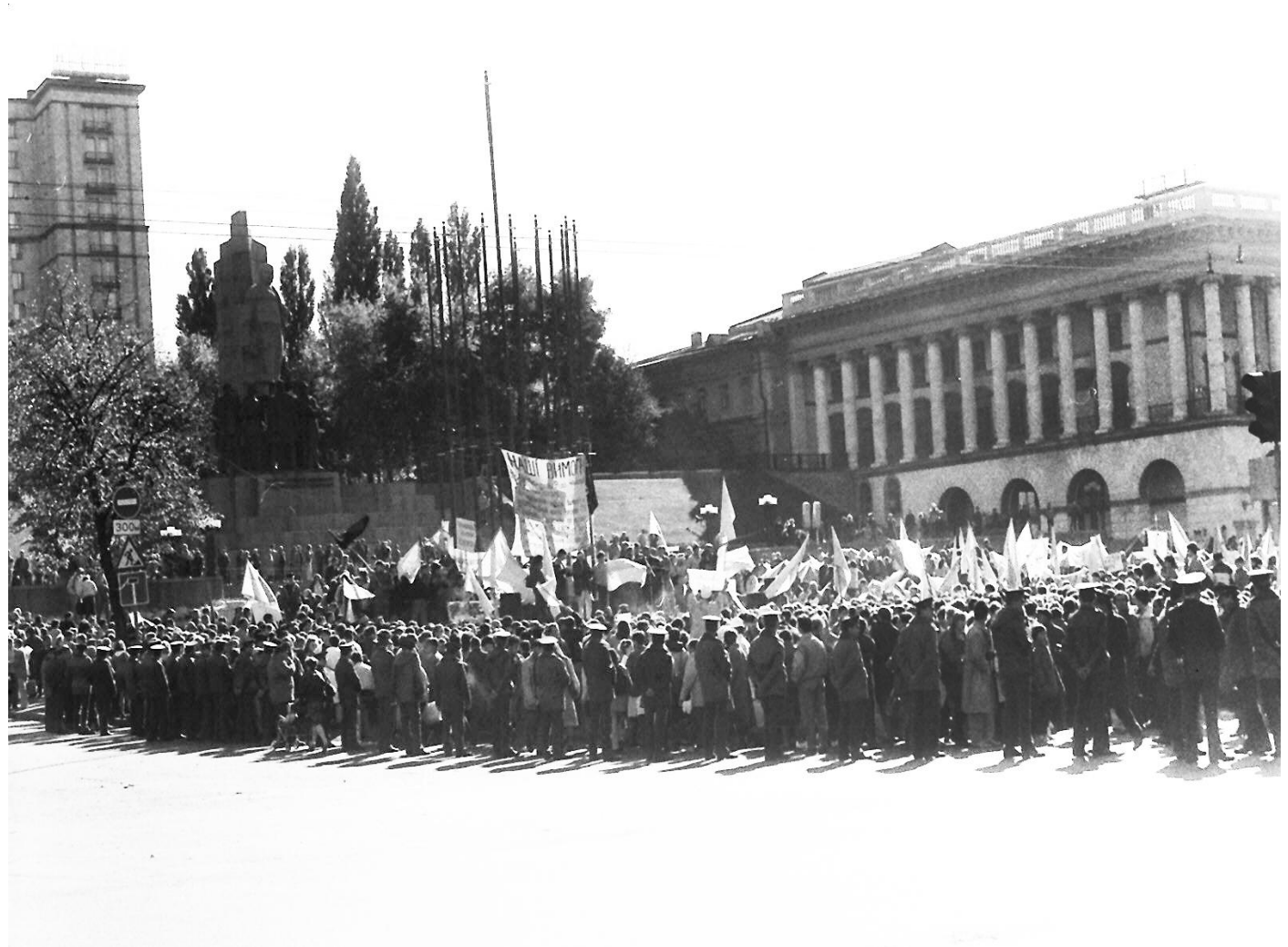
Кордони міліції навколо наметового містечка у середмісті столиці. Вигляд табору протестувальників.

На стрічці, якою був огорожений табір, протестувальники повісили аркуш з написом «майдан Незалежності».