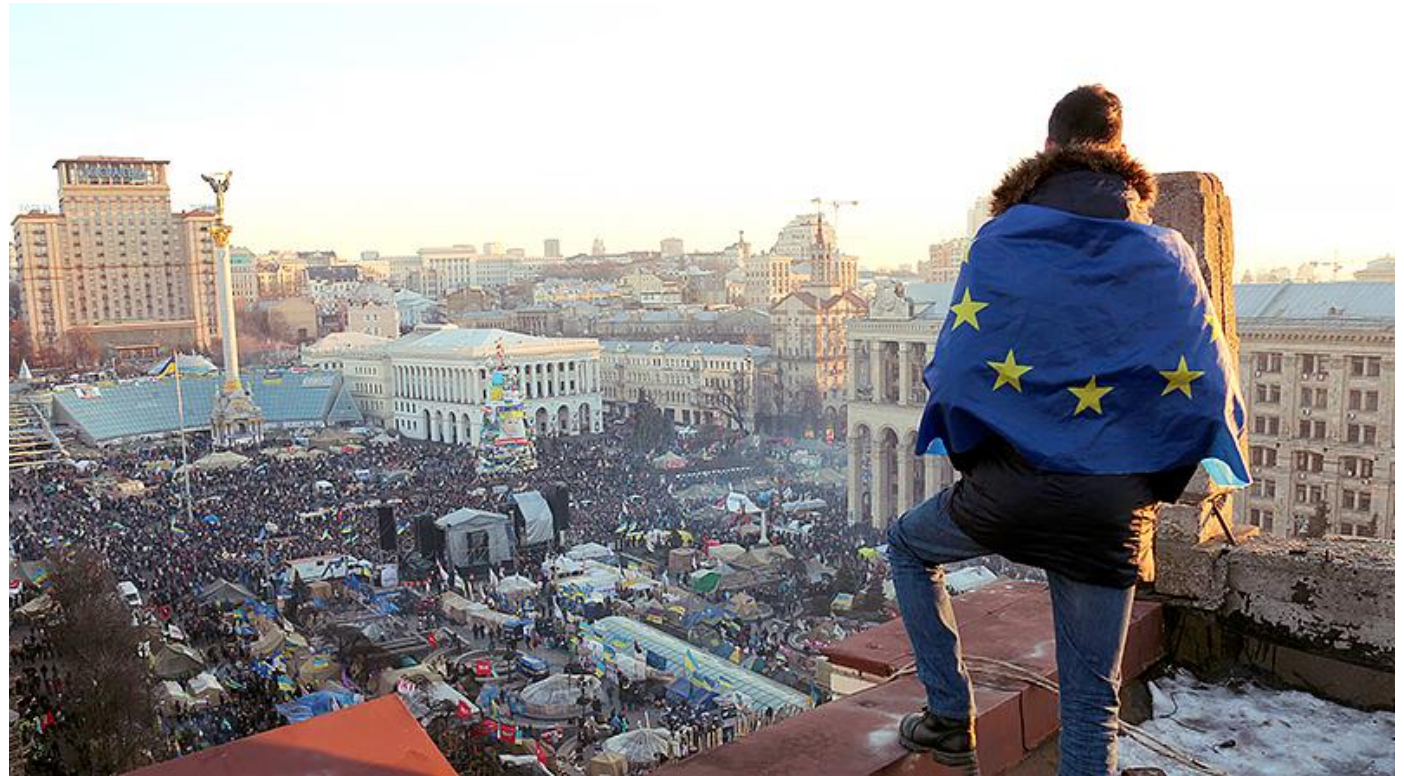
Євромайдан / Революція Гідності.

Сформовано покоління активістів, які продовжили громадянську та політичну діяльність у незалежній Україні та стали активом наступних Майданів: Помаранчевої революції та Революції Гідності.