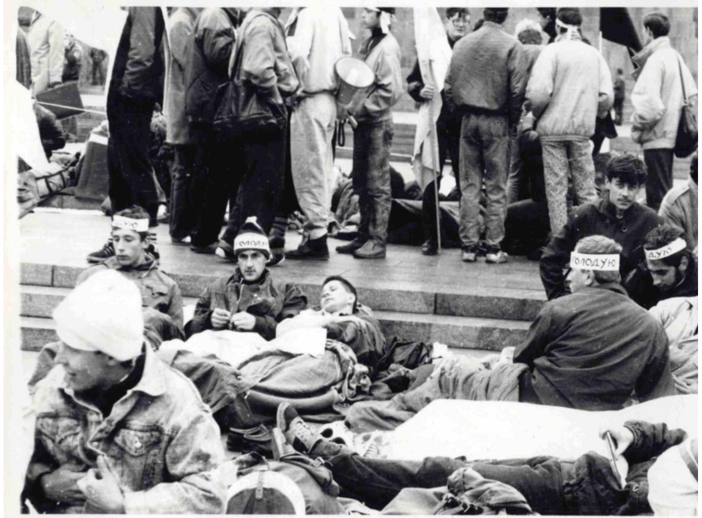
Першій день голодування.

Акцію планували провести під будівлею Верховної Ради. Проте вранці 2 жовтня загони міліції оточили споруду. Частина мітингувальників, які вийшли на площу Жовтневої революції, вирішили розпочати протест там. Увечері на головній площі Києва з'явилося наметове містечко.