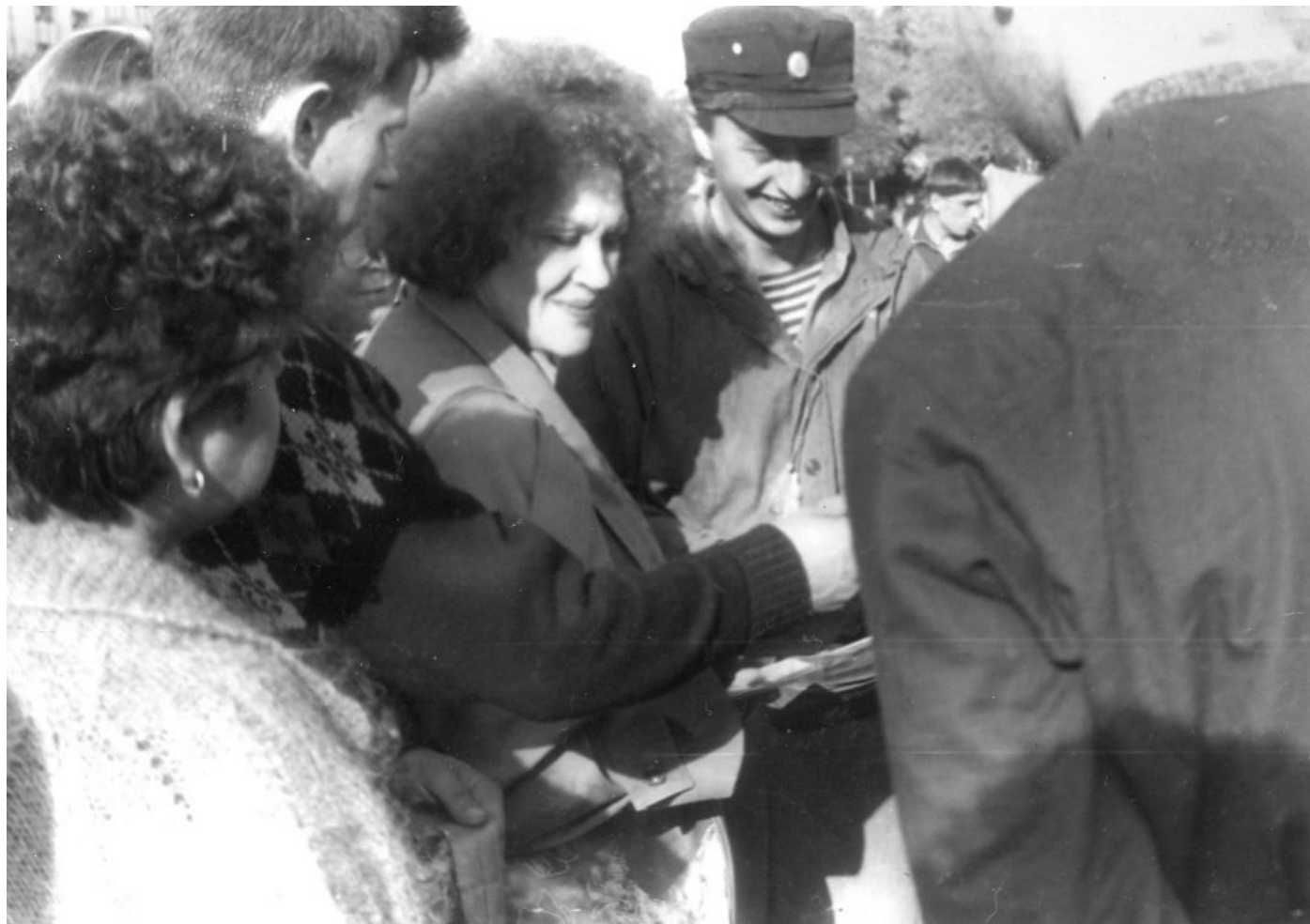
Поетеса Ліна Костенко у таборі голодуючих студентів.