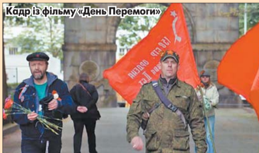
Кадр із фільму «День Перемоги»