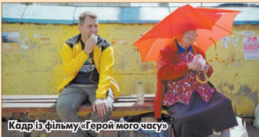
Кадр із фільму «Герой мого часу»

Третій рік поспіль у світі проходить День арт-кіно Європи, ініційований Міжнародною конфедерацією архаусних кінотеатрів для популяризації європейського кіно та діяльності кінотеатрів архаусного типу. Минулого року до акції приєдналися 600 закладів. У столиці спеціальну програму заходів готує кінотеатр «Жовтень».